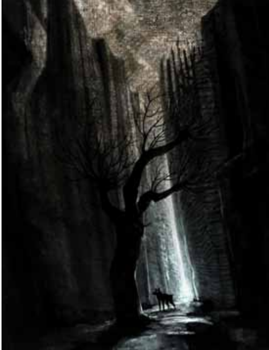
Sortida , La terra còncava, 2011