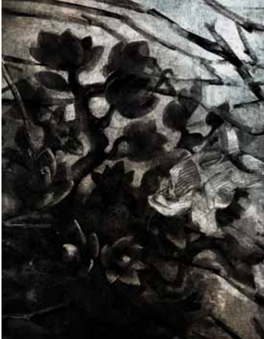
Martiri , La terra còncava, 2011