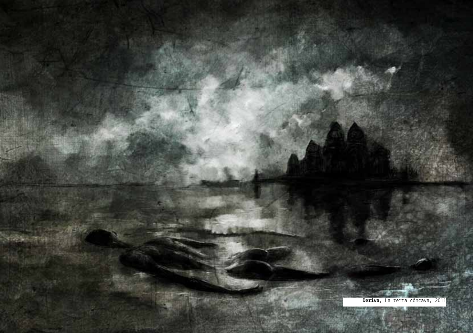
Deriva, La terra còncava, 2011