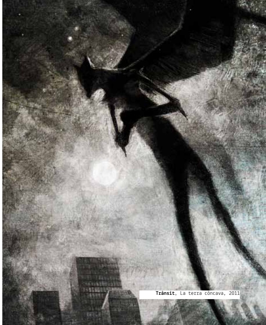
Trànsit, La terra còncava, 2011