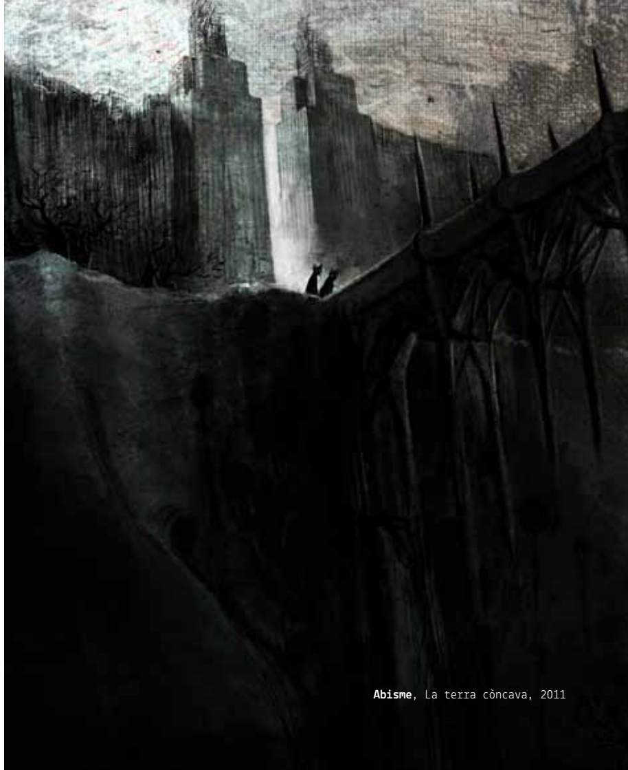
Abisme, La terra còncava, 2011